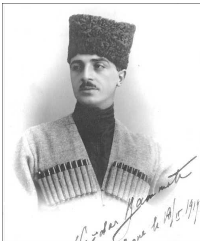
Хаидар Баммағ 1890-19