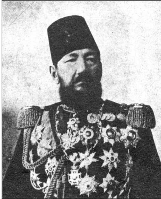
Амаршал Фуат Пашья Туга

Стампыли Каири арратә цара даналга иеиуеипшым ахырхартақәа рҕы айбашьрақәа дрылахәны ақәҕиарақәа ааирцшит. Стампыл ақалақь ахьчараан игәымшәарей ифырхатдарей рзы амаршалра ианашьахейт. Дахьыҕазаалак кавказаа рызцаарақәа рзы дықәпон. Иажәа дахьамеигзоз, насгы асултанцәкьа дахьицәымшәоз азы «ахага» хәа ахьзшьа иман. Кавказаа иапырцаз ахейдкылақәа активла зәалазырхәуаз дыруазәкын.