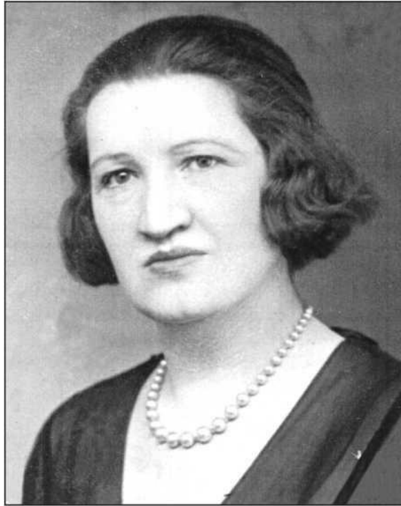
Ҳаирие Мелеқъ Ҳэынча

1896 ш. азы Ғырқэтэыла Маниас Ҳацыосман ақытағы диит. Ускантэи аамтазы иреиғыз атцарайуртас иказ “Notre Dame de Sion” далгеит. Атырқэшэеи афранцуз бызшэеи рыдагы ақсшэеи, адыгбызшэеи, аубых бызшэеи бзиазаы илпыруан. Кавказаа ирызкыз ахеидкылақэа реихарак рнапхгара активла дрылахэын. Рақхыза аинрал Меғ Иззет Чанатука диман, уи ицстазаара даналтц иеиқырдыруа кавказтцаағы Аиҫеқъ Намиток диццеит. Иеиуеицшым агазетқэеи ажурналқэеи лусумтақэа рнылахэеит. Кавказаа рақхызатэи ашэқэыағы ақхэыс хэагы лзырхэоит.